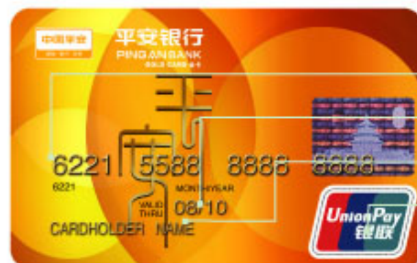
银联人民币卡正面