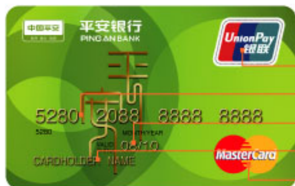
万事达双币卡正面