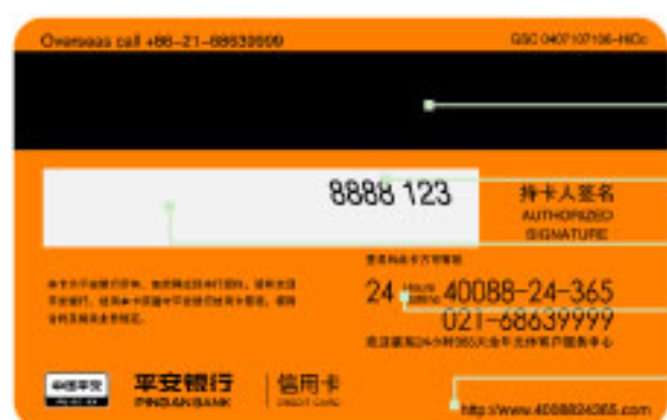
银联人民币卡背面